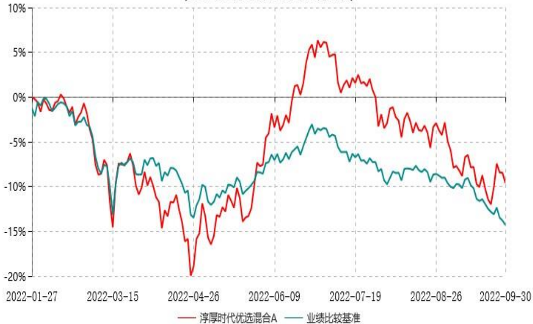
淳厚时代优选混合A累计净值增长率与业绩比较基准收益率历史走势对比图 (2022年01月27日-2022年09月30日)

注：本基金基金合同生效日为 2022 年 1 月 27 日，至报告期末未满 1 年。按基金合同规定，本基金自基金合同生效起 6 个月内为建仓期。建仓期结束时本基金的各项投资比例均符合基金合同约定。