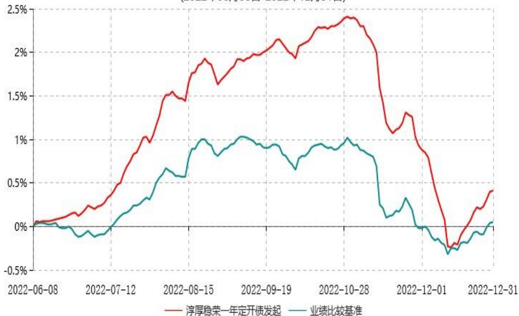
淳厚稳荣一年定期开放债券型发起式证券投资基金累计净值增长率与业绩比较基准收益率历史走势对比图 (2022年06月08日-2022年12月31日)

注：本基金基金合同生效日为2022年06月08日，至报告期末未满1年。按基金合同规定，本基金自基金合同生效起6个月内为建仓期。建仓期结束时本基金的各项投资比例均符合基金合同约定。