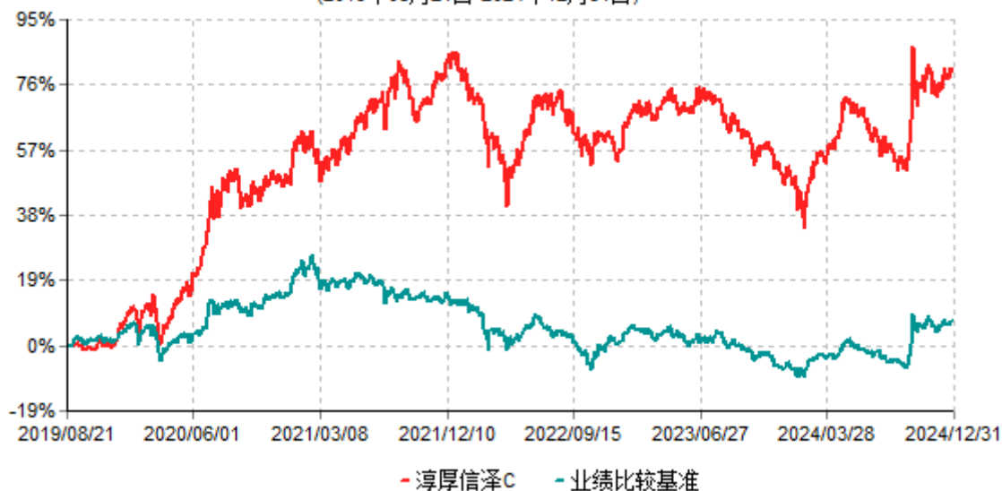
淳厚信泽C累计净值增长率与业绩比较基准收益率历史走势对比图 (2019年08月21日-2024年12月31日)

注：本基金基金合同生效日为2019年8月21日。按基金合同约定，本基金自基金合同生效起6个月内为建仓期。建仓期结束时本基金的各项投资比例均符合基金合同约定。