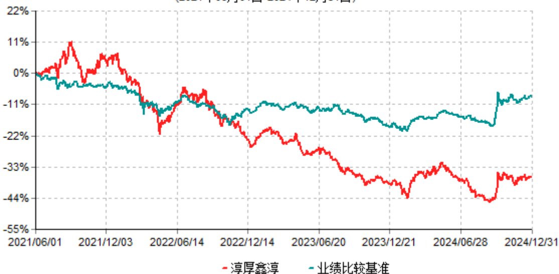
淳厚鑫淳累计净值增长率与业绩比较基准收益率历史走势对比图 (2021年06月01日-2024年12月31日)

注：本基金基金合同生效日为2021年06月01日。按基金合同规定，本基金自基金合同生效起6个月内为建仓期。建仓期结束时本基金的各项投资比例均符合基金合同约定。