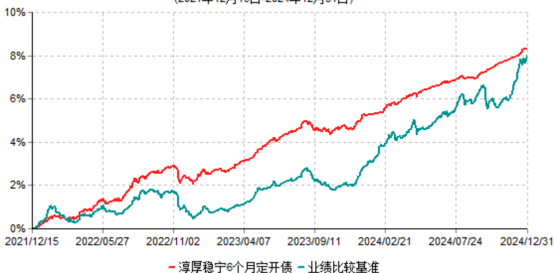
淳厚稳宁6个月定开债累计净值增长率与业绩比较基准收益率历史走势对比图 (2021年12月15日-2024年12月31日)

注：本基金基金合同生效日为2021年12月15日。按基金合同规定，本基金自基金合同生效起6个月内为建仓期。建仓期结束时本基金的各项投资比例均符合基金合同约定。